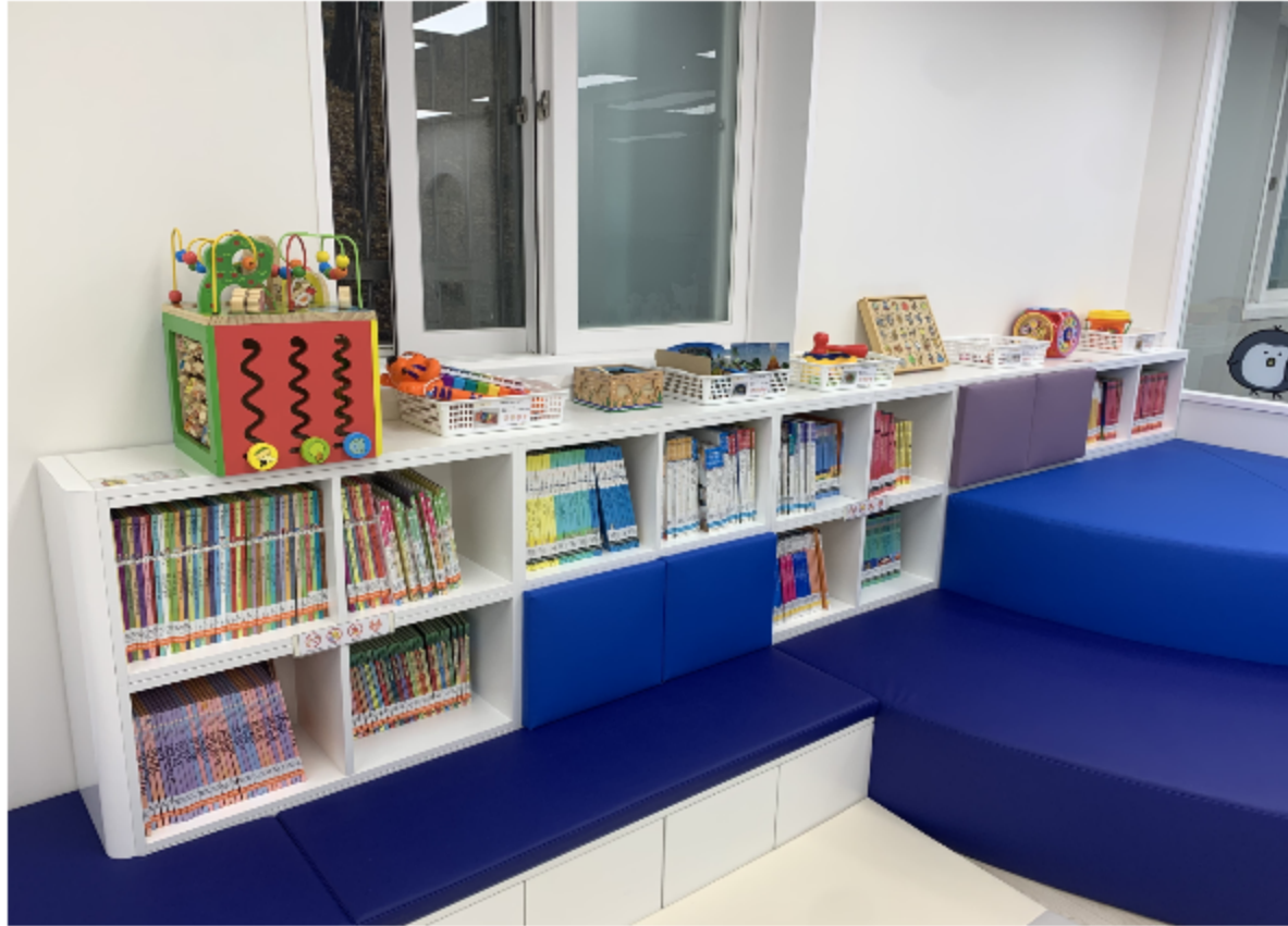
도서 및 장난감