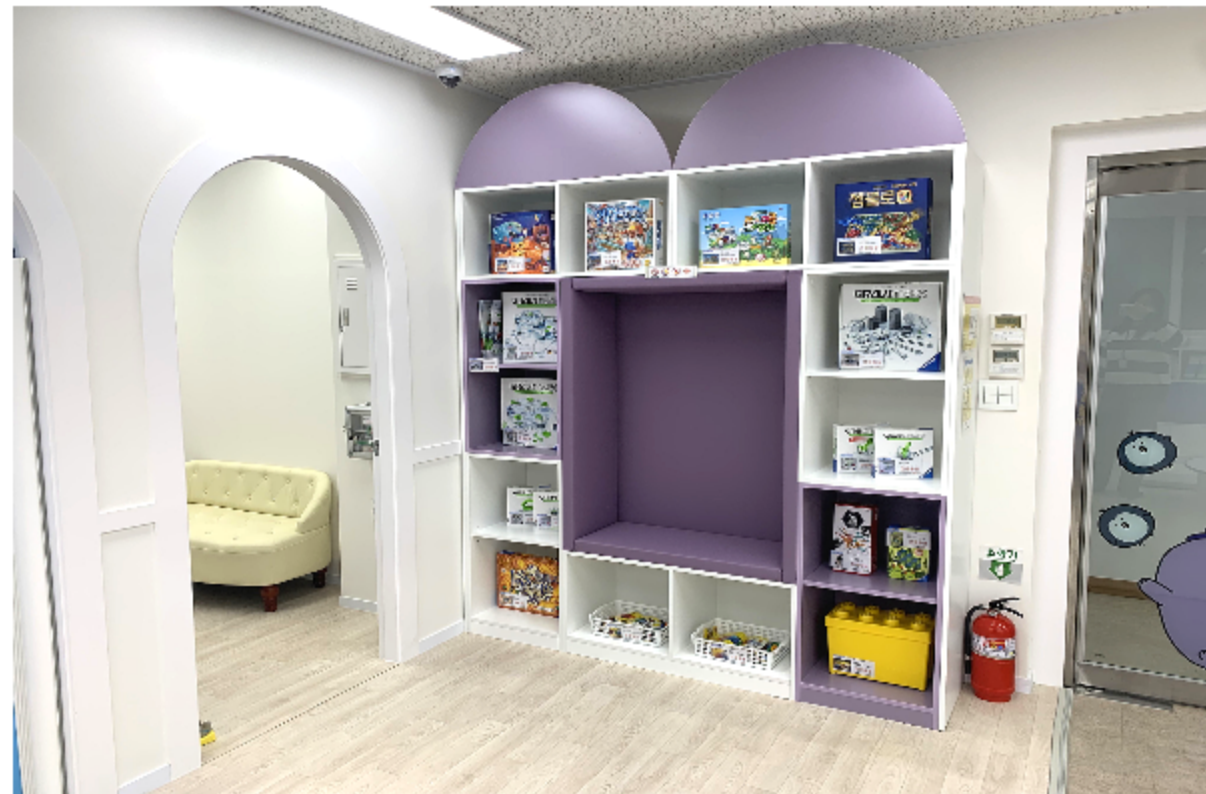
보드게임과 과학놀이 교구